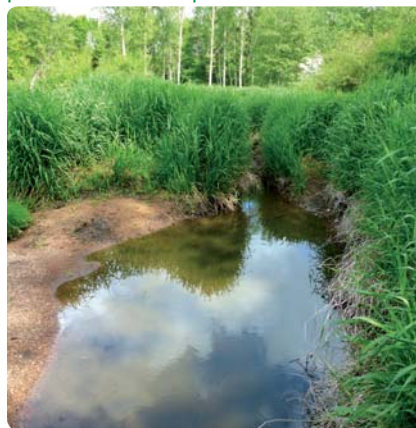
Zone alluviale gorgée d'eau de crues

Elles sont particulièrement bienvenues en période sèche et sont essentielles à la production d'eau potable.