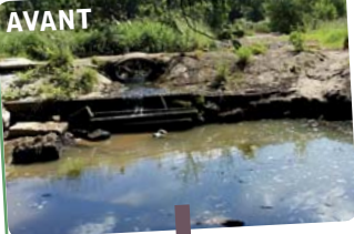
Seuil de la Fleur de Lierre