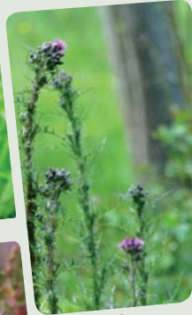
Cirse des marais