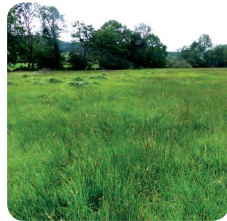
Belle prairie pâturée typique sur le territoire, en bon état de conservation