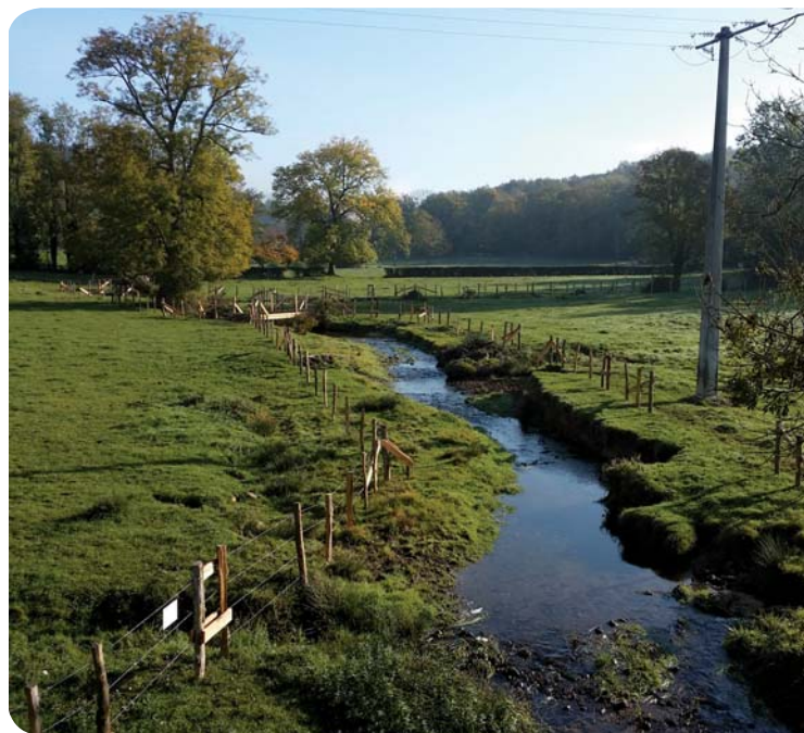
Mise en défens du Chandonnet à Chandon