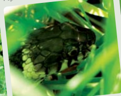
La couleuvre à collier chasse dans les prairies humides et lézarde au soleil sur les bords de cours d'eau.