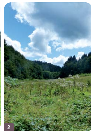
Zone en moyen état de conservation, en cours de fermeture du milieu, c'est-à-dire qu'elle se transforme en forêt (évolution d'une même parcelle 1 en quelques années 2 suite à l'abandon du pâturage)

Suivant le niveau d'impacts observé, les zones humides vont perdre leurs fonctions naturelles, et les services rendus par ces milieux seront amoindris voire complètement altérés. Les zones humides sont parfois abandonnées par l'agriculture car trop difficiles à exploiter et ont alors tendance à se fermer naturellement. Au fil du temps, cette évolution va assécher la zone humide qui perdra alors ses fonctions naturelles globales !