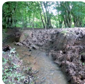
Zone en mauvais état de conservation, très impactée par le surpâturage