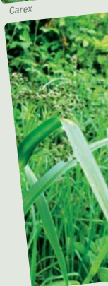
Scirpe des bois