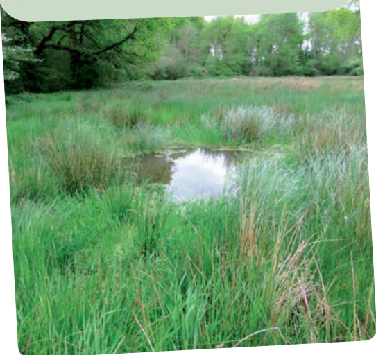
Belle mare prairiale

Tout cet ensemble de milieux humides et aquatiques forme un réseau dense avec des fonctions naturelles indispensables qui rendent de nombreux services à la population.