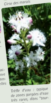
Trèfle d'eau : typique de zones gorgées d'eau très rares, dites "tourbeuses".